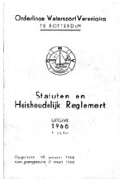
De eerste uitgave van de statuten en reglementen