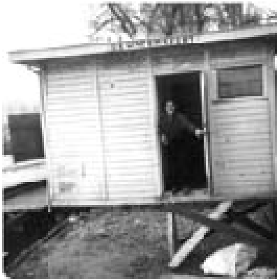
Het allereerste clubhuis van de vereniging 1966