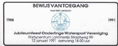
Toegangsbewijs 25 jarig jubileumfeest