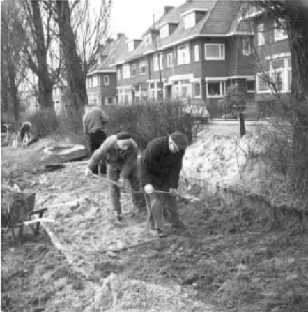
werkbeurt 1966, aanleg talud

Van het bestuur kunnen uitsluitend meerderjarige werkende leden deel uit maken, overeenkomstig het bepaalde in artikel 10 lid 2 van de statuten. Bestuursleden worden gekozen door de algemene ledenvergadering en hebben maximaal zitting voor drie jaar en zijn direct herkiesbaar. De voorzitter, secretaris, penningmeester en terreincommissaris